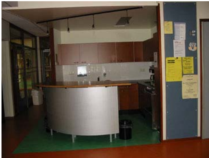
De keuken met apparatuur

Net als bij woningen is er een jaarlijkse huurprijsstijging mogelijk in juli. Voor incidentele verhuur wordt per keer een offerte gemaakt en wordt de huurder geïnstrueerd hoe met de ruimten, de apparatuur en de beveiliging om te gaan.