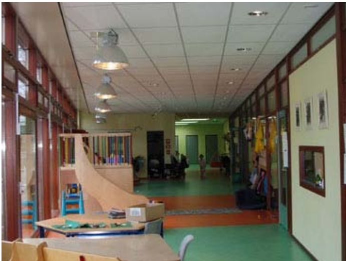
De kinderopvang in vrolijke kleuren

En tot slot is deze manier van werken haalbaar doordat de kinderopvang een permanent aanwezige huurder is. De kinderopvang heeft een eigen deel van het gebouw maar is wel binnendoor bereikbaar. Is er iets aan de hand of weet men even niet hoe iets werkt, dan kunnen medewerkers van de kinderopvang even inspringen of bellen zij Pares.