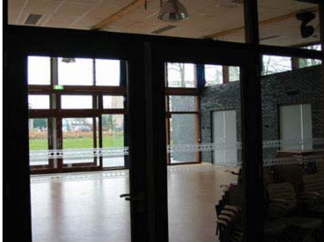
De grote zaal met meubilair aan kant