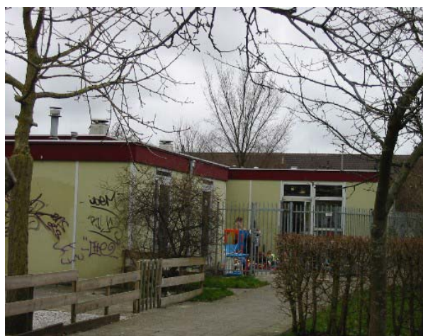
Woonzorgzone Westeinde: wijkwelzijnscentrum oude situatie