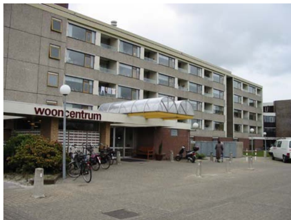
Woonzorgzone Westeinde: woon- en zorgcentrum oude situatie

De zittende bewoners van Swettehiem hechten echter ook aan eigen, besloten activiteiten. Voorgesteld wordt om dit op te lossen door "doelgroep-uren" in te stellen, maar wel dezelfde multifunctionele accommodatie te gebruiken.