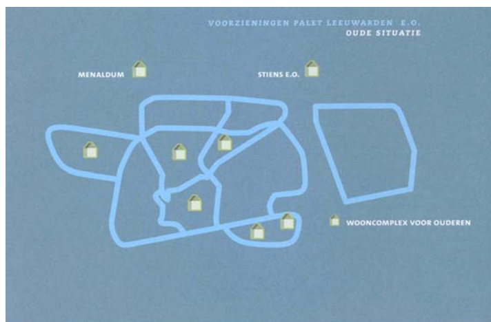
Voorzieningen Leeuwarden oude situatie

Een eerste uitwerking van het nieuwe model heeft plaatsgevonden voor de pilot-wijken Westeinde en Vrijheidswijk. In de loop van 2002 verschijnt een brochure over het Leeuwardense model.