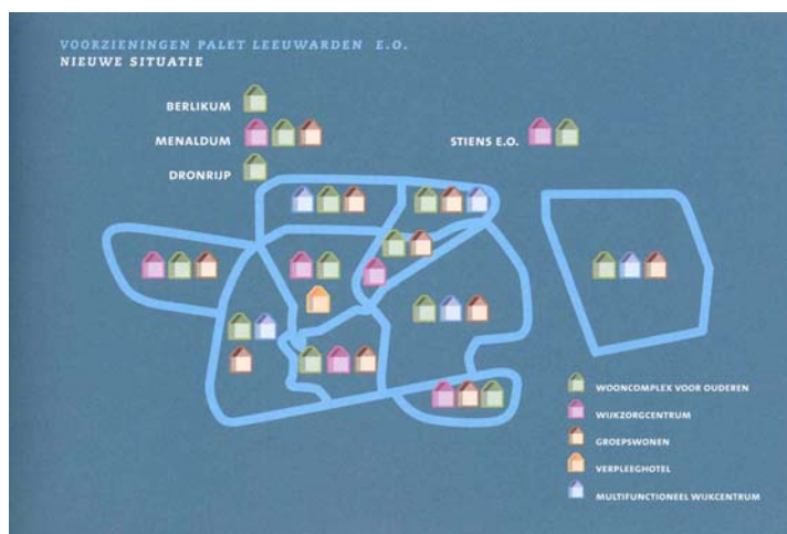
Voorzieningen Leeuwarden nieuwe situatie